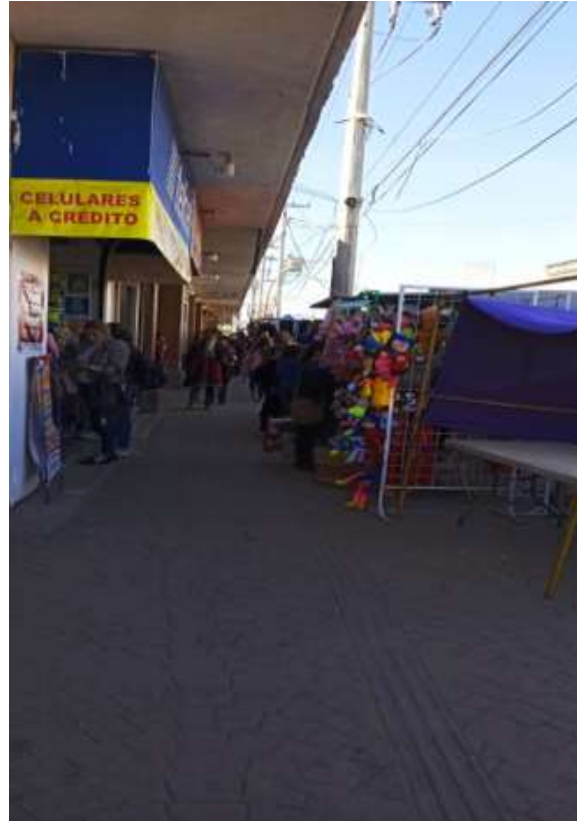
Venta Navideña de puestos semifijos en el Mercado Municipal 01/12/22.